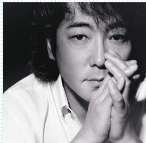
佐野元春 (ミュージシャン)