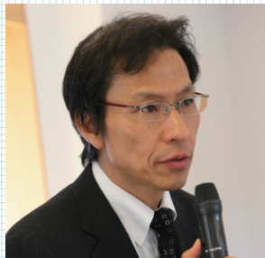
姜尚中 (東京大学大学院情報学環教授)