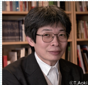
平田オリザ (劇作家、大阪大学教授)